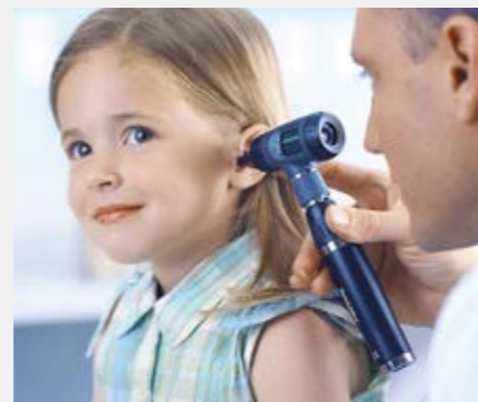
FORBEDRER VISUALISERINGEN AF ØRERNE

* Dybdeskarphed fra 4 til 140 mm, fokus fra spidsen af 4 mm spekulum