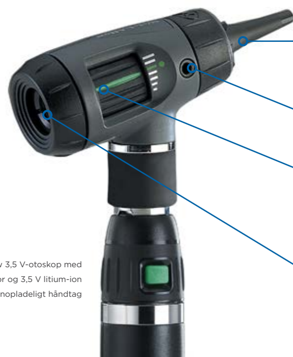
MacroView 3,5 V-otoskop med svælgilluminator og 3,5 V litium-ion genopladeligt håndtag

Patenteret "Tip Grip" sikrer, at spekula er sikkert fastgjort og afskyder det brugte ørespekulum, så det er nemt at bortskaffe